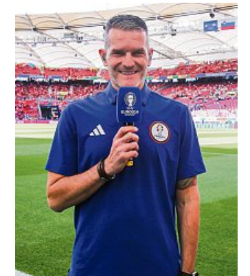
EURO-Stadionsprecher Jens Zimmermann.